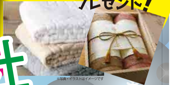
※写真・イラストはイメージです